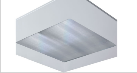
Difusor de policarbonato microprismático rayado